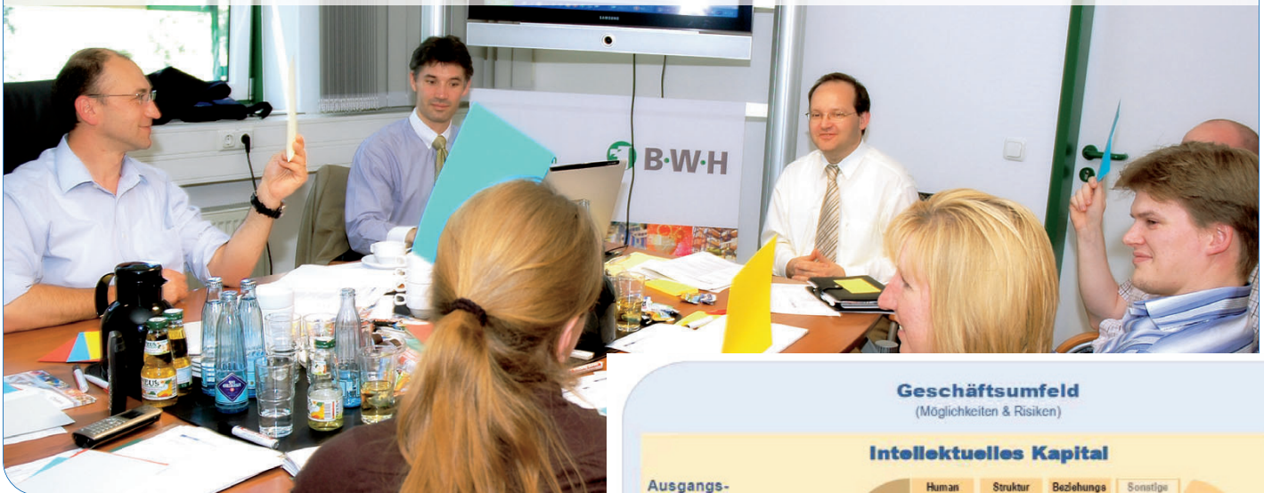
Die Projektgruppe bei der Erarbeitung der Wissensbilanz-Toolbox.

Was weiß mein Unternehmen, wie kann ich das Wissen messen und fördern? Diese Frage ist besonders für kleine und mittelständische Unternehmen (KMU) bedeutend.